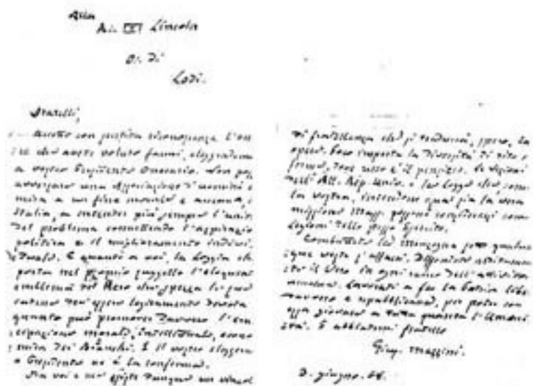
Lettere alle logge massoniche

( Scritti editi e inediti , Edizione Nazionale, LXXXVI, Politica XXVIII, pp. 303-304)